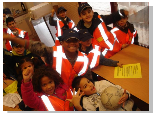
De Portiek Portiers van het Bastion